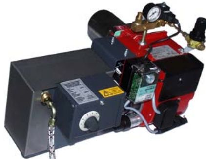
Strom und Wärme mit