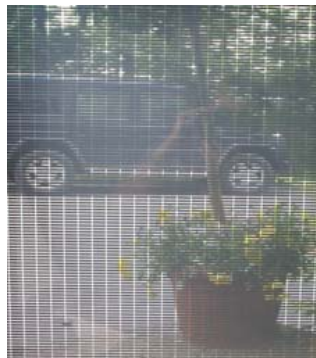
Solarstromdächer Fassaden transparente Module