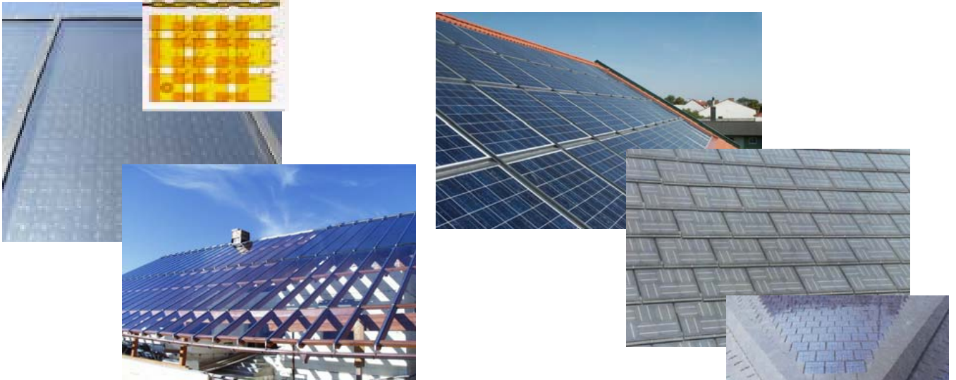
Solardächer für Warmwasser und Heizung

(100%-ige Energieversorgung mit Strom und Wärme aus nachwachsenden Rohstoffen und aus der Sonne)